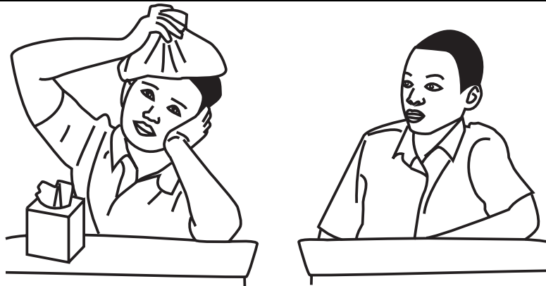
Jídé àti Túndé n sòrò nípa ìlera.